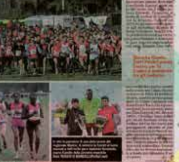
La squadra di atleti della Cento Torri, campioni di corsa campestre