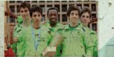
Altri atleti della Cento Torri, campioni di corsa campestre

Una squadra di atleti che ha fatto parlare di sé in tutta Italia. Cento Torri, la società pavese di atletica leggera, ha ottenuto il riconoscimento di Federatetica, la federazione italiana di atletica leggera, per aver organizzato una delle migliori stagioni agonistiche del paese. La società pavese, che ha 100 atleti, ha ottenuto il riconoscimento di Federatetica per aver organizzato una delle migliori stagioni agonistiche del paese.