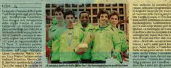
La squadra di atleti della Cento Torri, campioni di corsa campestre