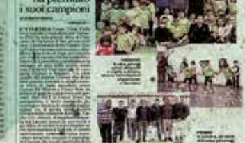
La squadra di atleti della Cento Torri, campioni di corsa campestre