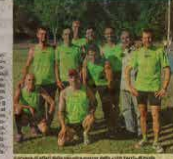
Il gruppo di atleti della Cento Torri, campioni di corsa campestre

Una squadra di atleti che ha fatto parlare di sé in tutta Italia. Cento Torri, la società pavese di atletica leggera, ha ottenuto il riconoscimento di Federatetica, la federazione italiana di atletica leggera, per aver organizzato una delle migliori stagioni agonistiche del paese. La società pavese, che ha 100 atleti, ha ottenuto il riconoscimento di Federatetica per aver organizzato una delle migliori stagioni agonistiche del paese.