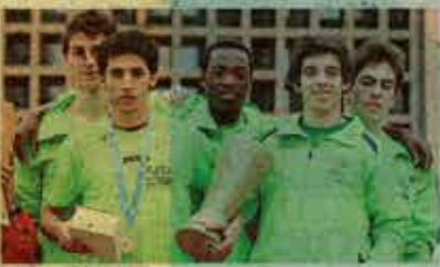
La squadra di atleti della Cento Torri

Una squadra di atleti che ha fatto parlare di sé in tutta Italia. Cento Torri, la società pavese di atletica leggera, ha ottenuto il riconoscimento di Federatetica, la federazione italiana di atletica leggera, per aver organizzato una delle migliori stagioni agonistiche del paese. La società pavese, che ha 100 atleti, ha ottenuto il riconoscimento di Federatetica per aver organizzato una delle migliori stagioni agonistiche del paese. La società pavese, che ha 100 atleti, ha ottenuto il riconoscimento di Federatetica per aver organizzato una delle migliori stagioni agonistiche del paese.